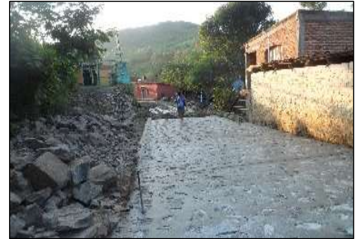
GDC El Magistral, Ameca