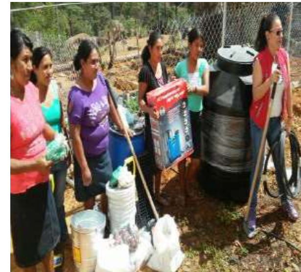
GDC Guayabillas, Cuautitlán de García Barragán.

Tenemos presencia en 7 de los 10 municipios prioritarios en el estado.