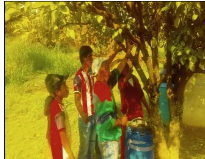
Capacitación de Acodo Aéreo, GDC San Sebastián Teponahuatlán, Mezquitic.