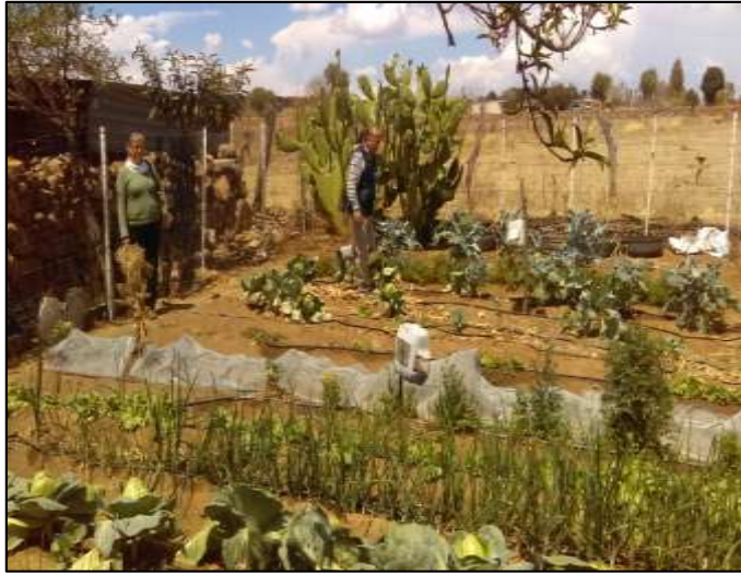
Huerto de Ramo 12 GDC de Santa Lucía, Totatiche