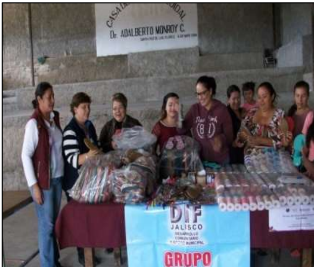
GDC Santa Cruz de la Flores, San Martín de Hidalgo

Recuperar la memoria histórica de las Comunidades y documentar el proceso mismo de la intervención.