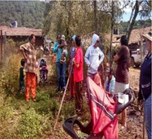
GDC Epenche Grande, Mazamitla.

Teniendo en cuenta que la definición del mensaje de el libro es sumamente importante, incluye en la presentación una serie de actores que son determinantes en el Desarrollo Comunitario de Jalisco.