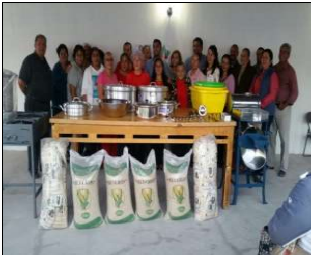
GDC San Ignacio Ojo de Agua, Ahualulco de Mercado

Con ésta estrategia, en DIF Jalisco reconocemos el esfuerzo de los Grupos de Desarrollo Comunitario y dirigimos acciones con el fin de que por medio de la participación activa e incluyente de todas y todos los integrantes del GDC, puedan presentar los impactos en su comunidad ( sistematización de los impactos generados a partir de la intervención con la Metodología Comunidad DIFerente ), en el cual se evidenciarán los diferentes aspectos que han permeado el proceso como tal, para beneficio personal, familiar y/o colectivo en donde la persona es el objeto, sujeto y timón de su propio desarrollo y no un mero receptor de ayuda asistencialista.