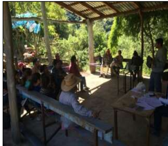
GDC Las Motas, Tamazula de Gordiano