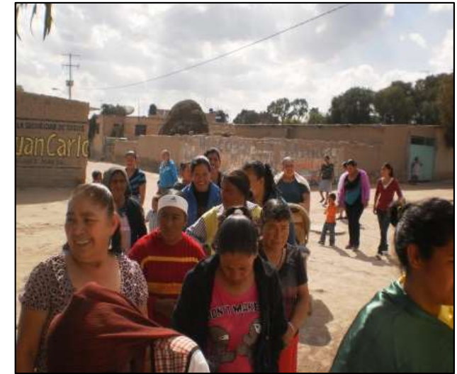
GDC Ninguno (La Granja), Ojuelos de Jalisco