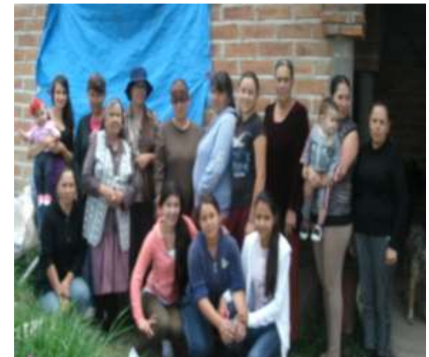
GDC Latillas, Tepatlán de Morelos