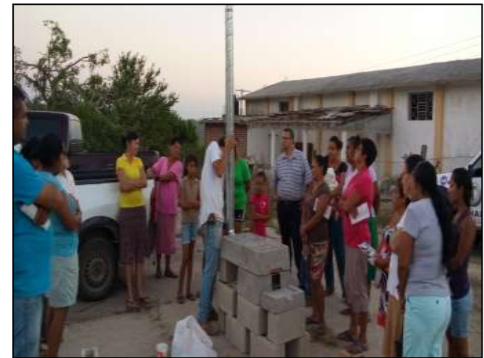
GDC Nacastillo, La Huerta