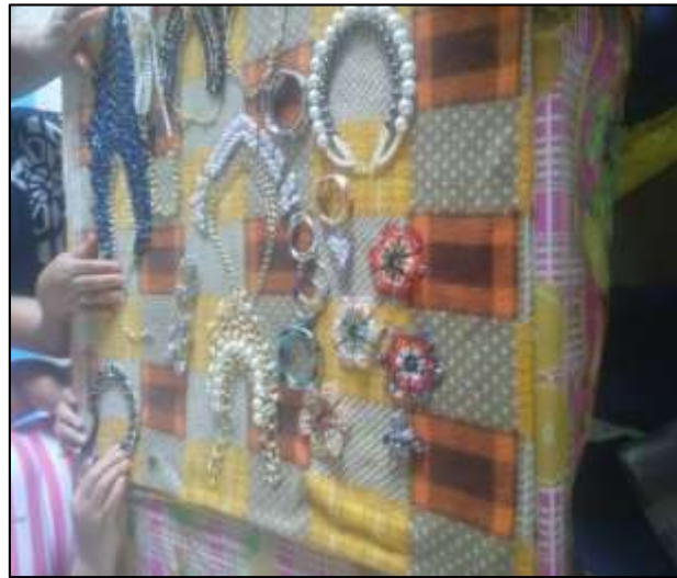
GDC Las Maravillas, Tecalitlán