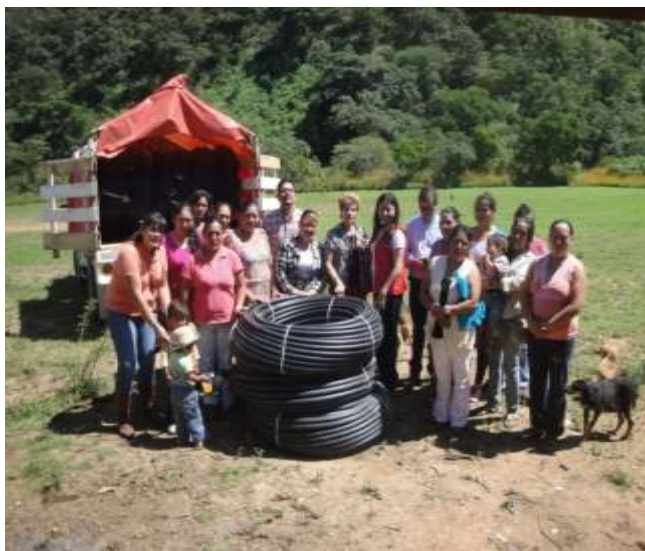
GDC Tescalama, Talpa de Allende

El libro se estructura en cuatro apartados :