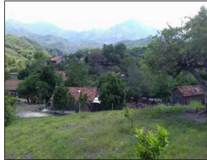
Vista General del la localidad de los Charcos, San Sebastián del Oeste