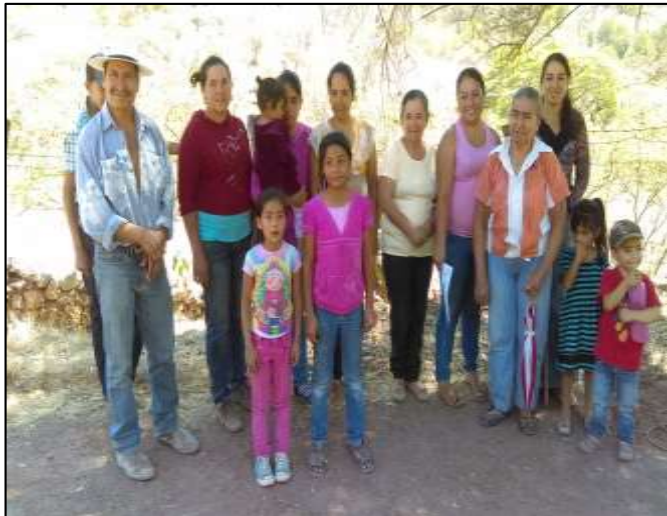
GDC San José de Corrales, Mascota